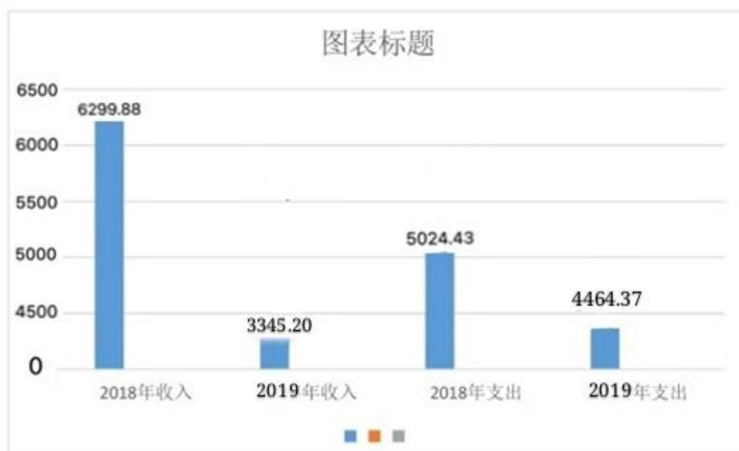
图 2：2018-2019 年财政拨款收支情况

本部门 2019 年度形成的财政拨款收支均为一般公共预算财政拨款，其中本年收入 3345.20 万元，比 2018 年度减少 2954.68 万元，降低 46.9%，主要是响应国家号召，减少开支。本年支出 4464.37 万元，减少 560.06 万元，降低 11.14%，主要是响应国家号召，减少开支。