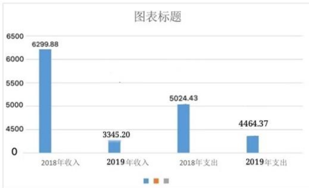
图 2：2018-2019 年财政拨款收支情况

本部门 2019 年度形成的财政拨款收支均为一般公共预算财政拨款，其中本年收入 3345.20 万元，比 2018 年度减少 2954.68 万元，降低 46.9%，主要是响应国家号召，减少开支。本年支出 4464.37 万元，减少 560.06 万元，降低 11.14%，主要是响应国家号召，减少开支。