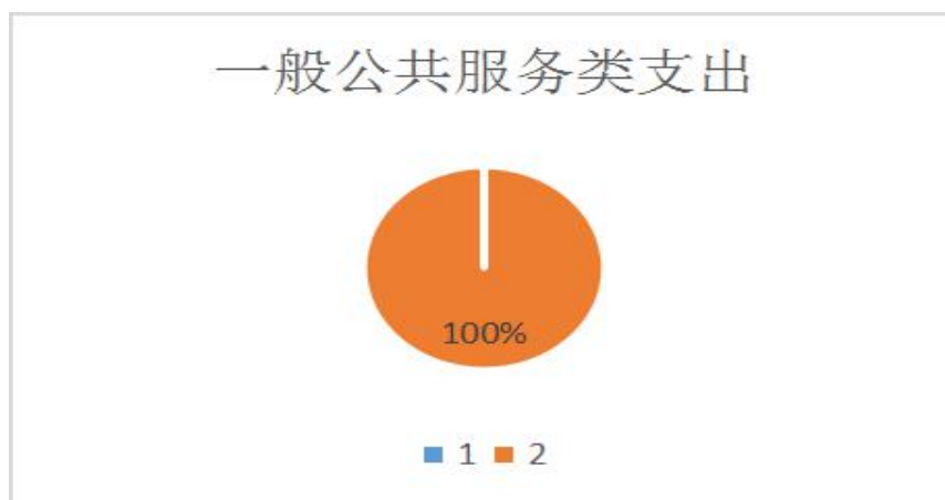
图 5：财政拨款支出决算结构（按功能分类）

(类)支出 0 万元，占 0%；教育（类）支出 0 万元，占 0%；科学技术（类）支出 0 万元，占 0%；社会保障和就业（类）支出 0 万元，占 0%；住房保障（类）支出 0 万元，占 0%；