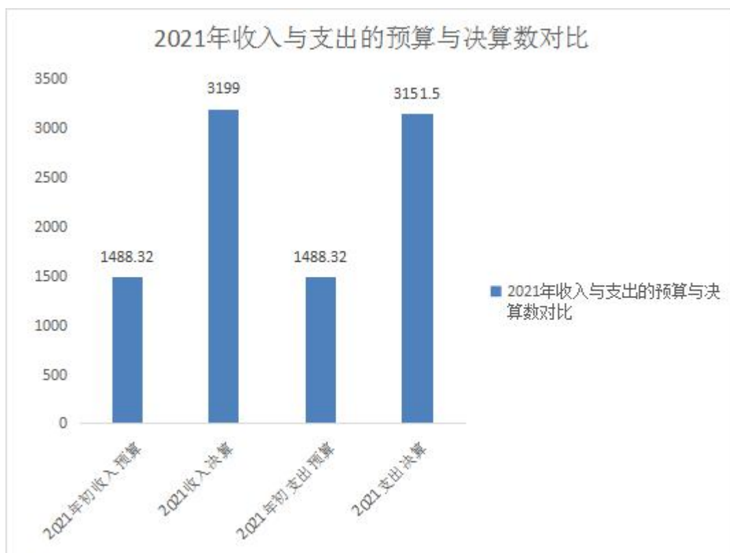
2021 年收入与支出的预算数与决算数对比情况（图 4）

本部门2021年度一般公共预算财政拨款收入3199.00万元，完成年初预算的115%，比年初预算增加1711.00万元，决算数大于预算数主要原因是人员增加及项目经费有所调整；本年支出3151.50万元，完成年初预算的112%，比年初预算增加1663.18万元，决算数大于预算数主要原因是主要是人员增加及项目经费有所调整。